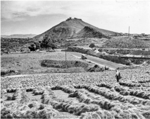
Campos de Tabernas