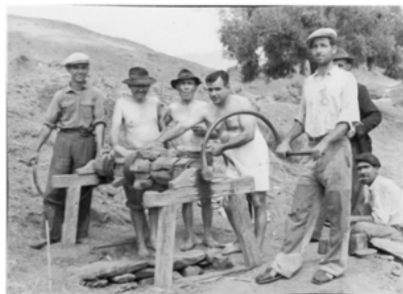
Construyendo la carretera