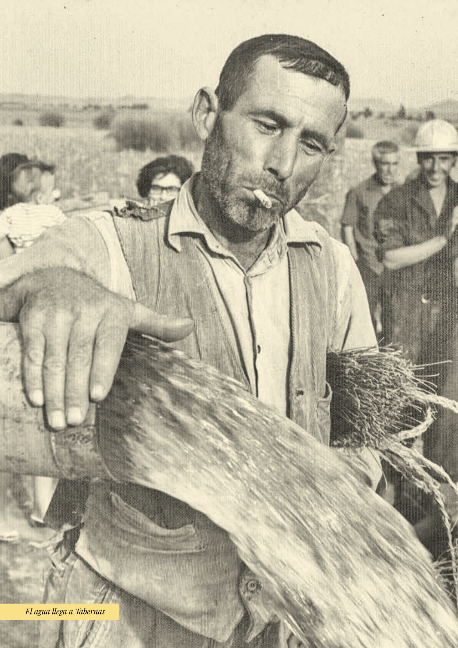
El agua llega a Tábernas