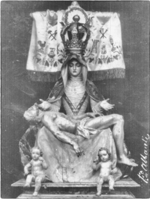
Virgen de las Angustias