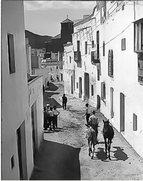
Barranco del caño