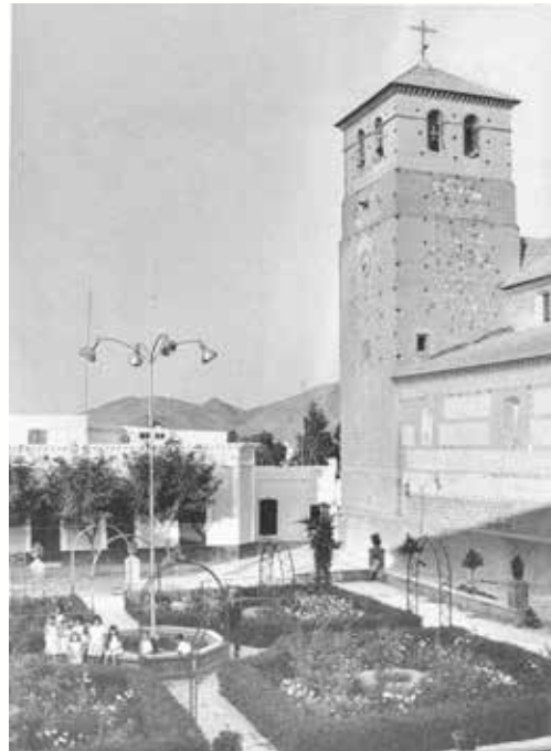
Glorieta de España