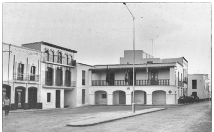
Plaza del Pueblo