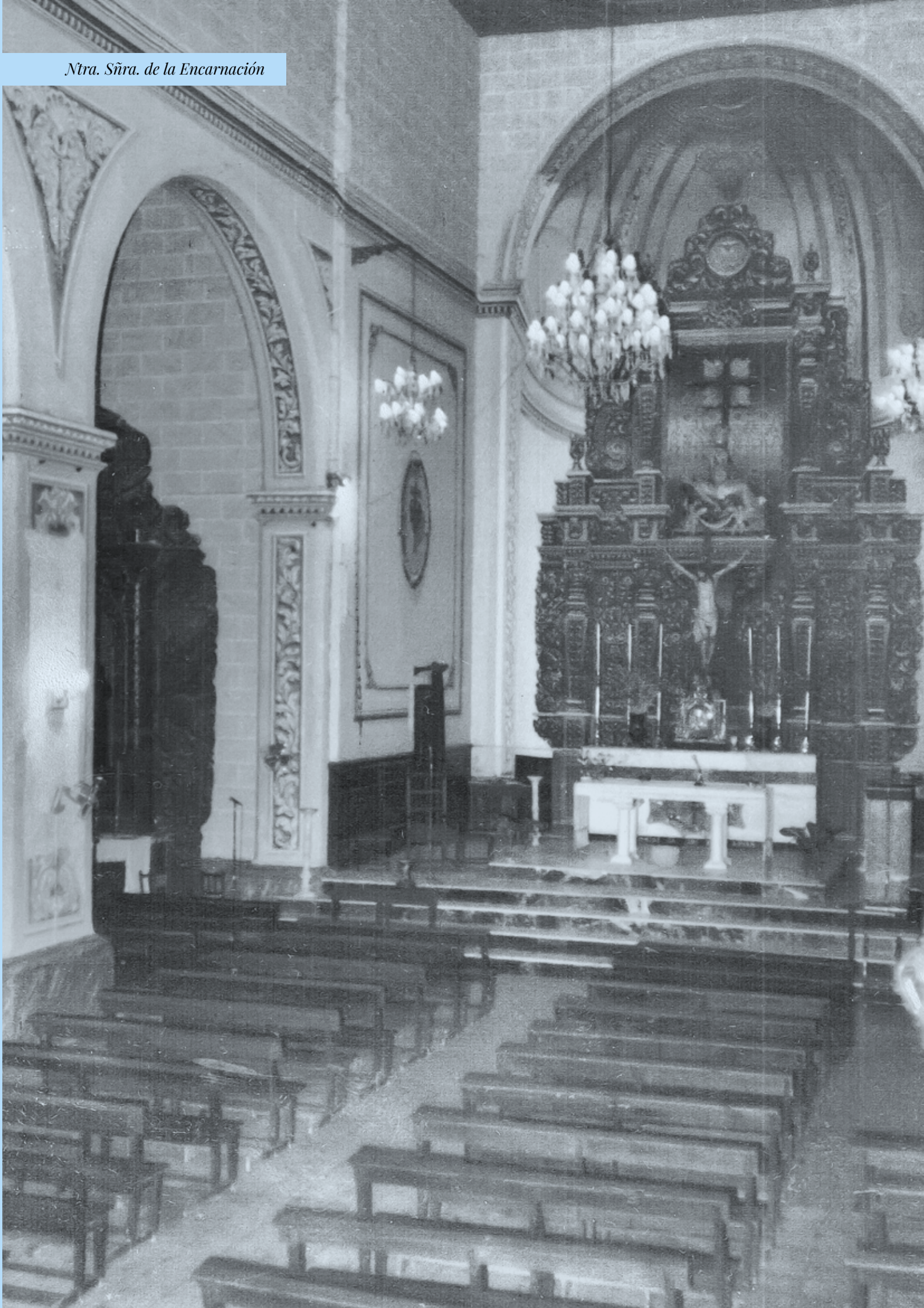
Ntra. Sñra. de la Encarnación