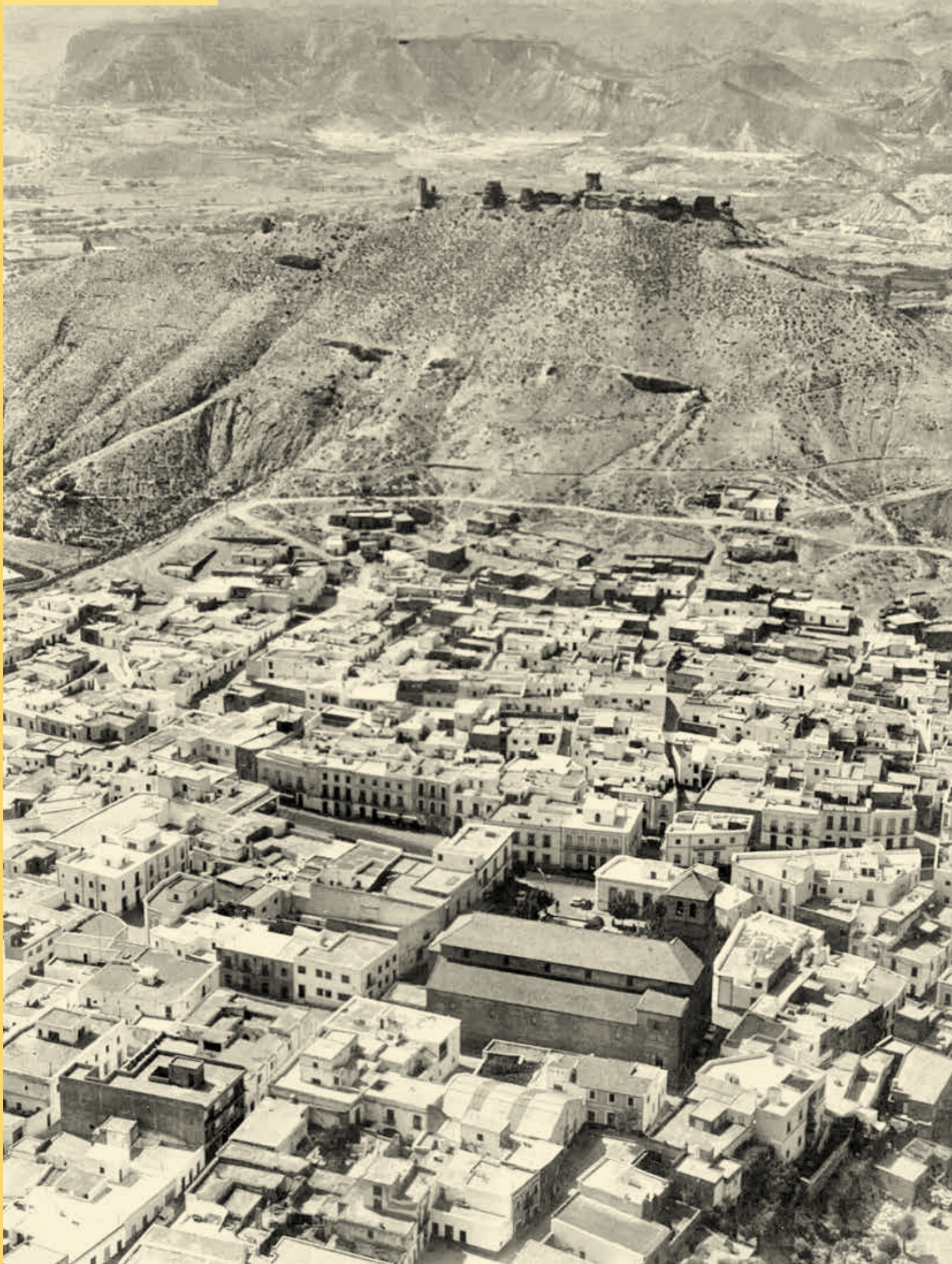
Tabernas, años 50