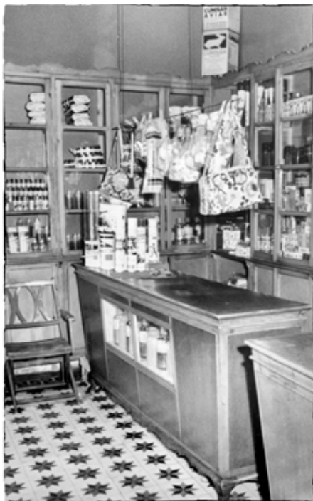
Pepico, el de la botica