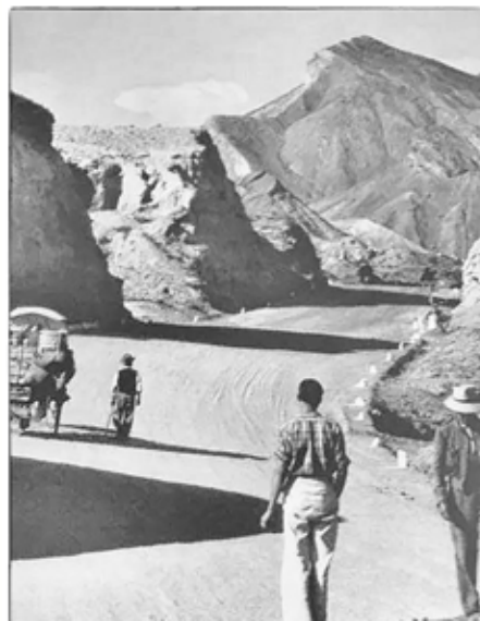
De Tabernas a Almería