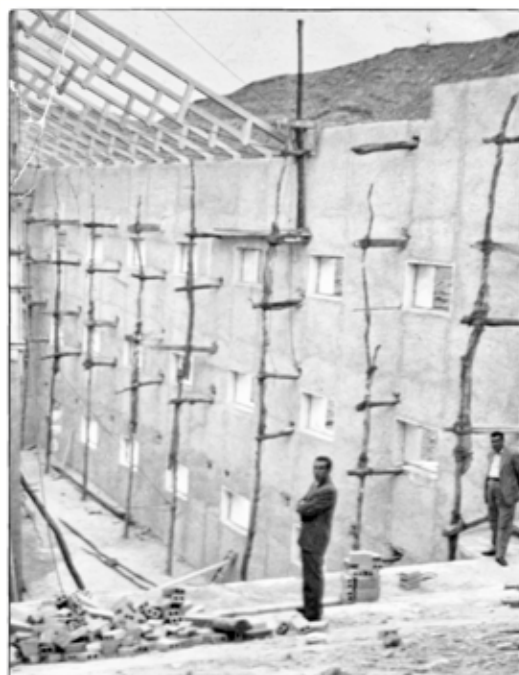
Levantando el teatro