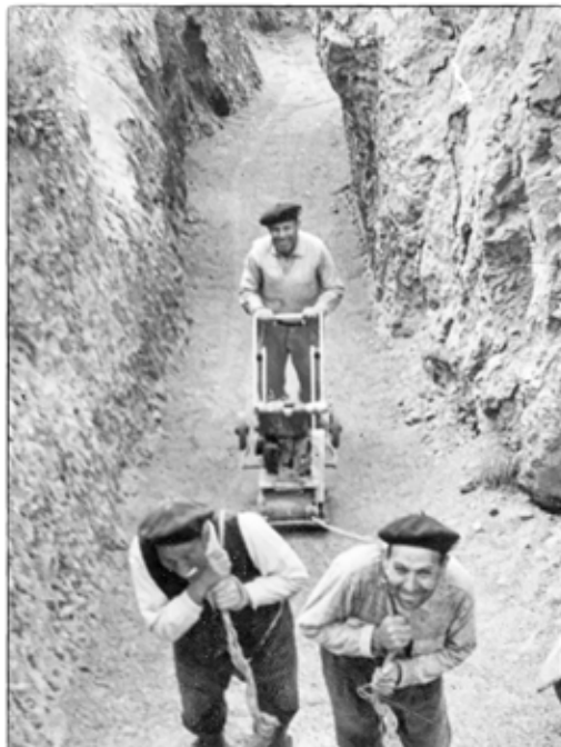
Cimentando el teatro